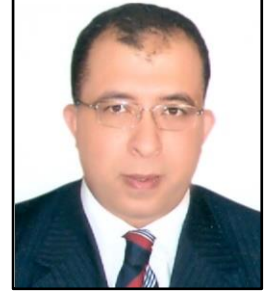
مُدَرِّب البرنامج أ.د. أشرف العربي

مستشار بالمعهد العربي للتخطيط بالكويت، عمل كمستشار بمركز دراسات السياسات الكلية بمعهد التخطيط القومي وكوزير للتخطيط والتعاون الدولي بجمهورية مصر العربية اعتباراً من أغسطس 2012. ثم وزيراً للتخطيط والمتابعة والإصلاح الإداري حتى فبراير 2017. حاصل على دكتوراه فلسفة في الاقتصاد من جامعة ولاية كانساس الأمريكية. عضو مجلس إدارة الجمعية العربية للبحوث الاقتصادية ومجلس أمناء المعهد العربي للتخطيط (سابقاً). له العديد من الأبحاث المنشورة وأوراق خلفية لتقارير دولية ووطنية. تشمل اهتماماته البحثية والاستشارية المحاور التالية: التخطيط والتنمية، التنافسية، أسواق العمل والهجرة، اقتصاديات التعليم والموارد البشرية، والفقر والتنمية الاجتماعية، والاقتصاد القياسي.